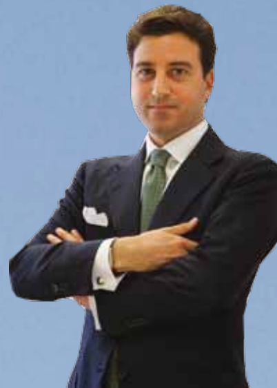
Fabrizio Capua Assessore Regione Calabria

A 15 anni dalla Dichiarazione di Barcellona, la necessità di rendere effettivamente operativa una zona di interscambio economico-commerciale tra le due rive del Mediterraneo è divenuta sempre più prioritaria. In questo scenario la Calabria, per ragioni storiche, geografiche ed economiche, è chiamata a svolgere un ruolo da protagonista che la metta in grado, sfruttando le proprie intrinseche potenzialità, di intercettare le concrete opportunità che possono derivare dal processo di cooperazione euro-mediterranea, consentendole con ciò di diventare un vero e proprio punto di riferimento nel Mediterraneo, non solo per l'Italia, ma per lo stesso continente europeo.