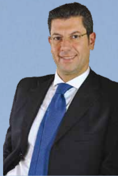
Giuseppe Scopelliti Presidente Regione Calabria

L a 1 a Conferenza Regionale sulla Cooperazione Internazionale e le Attività di Partenariato della Regione Calabria rappresenta una grande sfida per il rilancio della nostra regione nell'area euro mediterranea e un momento importante nel quale avviare un dialogo costruttivo. Dialogo che deve prevedere azioni sinergiche di collaborazione tra i paesi dell'Unione Europea e il partenariato mediterraneo, per contribuire ad una più concreta cooperazione euro-mediterranea al fine di rispondere alle sfide della globalizzazione e della crisi economica nel mondo.